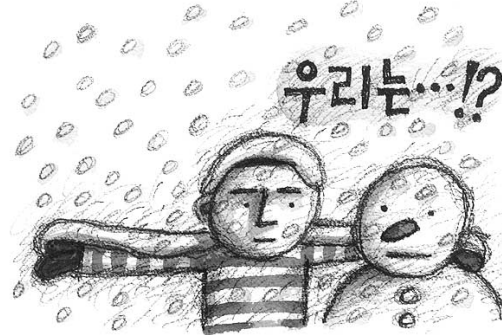
그림 : 문병성

초고속통신망 가입자 수가 1천160만을 넘는 오늘날 인터넷의 영향은 사회 각 분야에서 나타나고 있다. 종교영역도 예외는 아니어서 많은 종교 관련 사이트들이 생겨나고, 활발하게 움직이고 있다. 이 같은 새로운 추세에 주목하고 인터넷 이용이 종교영역에 야기한 변화와 그것의 종교사회학적 의미를 파헤친 박사학위 논문 ‘인터넷 이용과 종교의식’이 발표됐다.