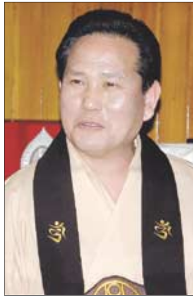
진각종 효암 총리원장

-먼저 금강회와 종단이 마음을 열고 종단 발전에 대해 논의할 수 있어야 할 것입니다. 격월로 개최되는 총금강회 회의에 총리원장을 비롯한 종단의 어른들이 참석할 수 있도록 자리를 마련할 것입니다. 그리고 총금강회의 활발한 활동을 위한 재정적 기반 마련