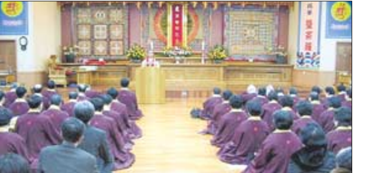
총지종은 1월13일 총지사에서 승단총회를 개최했다.