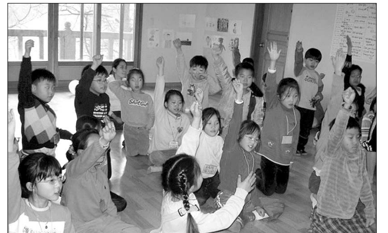
지난 12월 초에 열렸던 소림사 거울불교학교의 어린이들 모습.

서울 종로구 홍지동에 위치한 소림사. 절 이름이 중국영화에서 자주 나오는 소림사(少林寺)와 똑같은 눈길을 끈다. 도심 한복판에서 이처럼 아늑하고 조용한 분위기를 지닌 사찰도 드물다는 느낌이 드는 절. 하지만 이런 외형과는 달리 소림사는 지금 몇 십년을 내다보며 분주히 움직이고 있다. 어린이 포교도량으로 널리 알려져 있지만 소림사는 교육·포교·복지 등 종합 포교도량으로서의 면모를 갖추기 위해 면밀한 준비를 하고 있다.