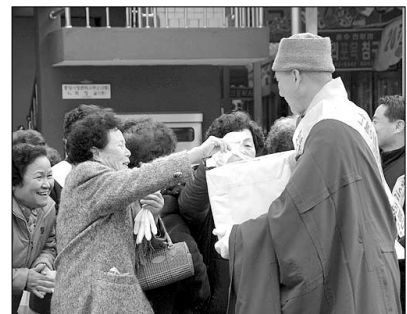
의성 고운사 거리탁발 장면.

남아시아 지진해일 피해민 지원을 위한 자비의 탁발행사는 이번 주에도 계속됐다.