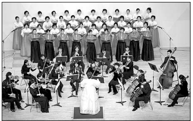
광주 5·18기념관에서 열린 무각사 합창단의 창단음악회.

광주 무각사(주지 광민) 합창단 창단을 기념하는 신년음악회가 1월 15일 5·18 기념