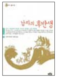
남자의 후반생 모리야 히로시 지음 | 양역관 옮김 푸른숲 | 1만1천원

한 사람의 인생에서 후반부의 삶이 차지하는 비중은 일반적으로 사람들이 생각하는 것보다 훨씬 크다. 이 책에 나오는 인물들의 삶은 그것을 단적으로 증명한다. 중국 역사에 뚜렷한 족적을 남긴 스물 두 명을 선정해 그들의 후반생을 중심으로 소개하고 있는 이 책은 언제 어떤 형태로 삶의 최전성기를 맞이하게 될지 누구도 알 수 없다는 사실을 확인시켜준다.