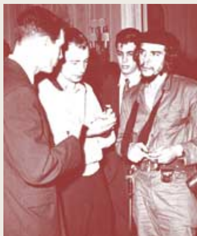
1959년 아르헨티나의 라디오 라바다비아와 인터뷰를 하고 있는 체 게바라(사진 맨 오른쪽).