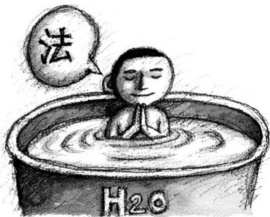
그림 : 문병성