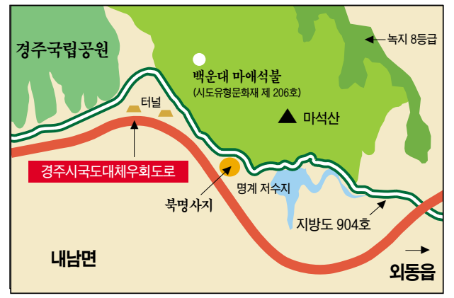
경주시 국도대체우회도로(내남-외동) 계획안에 따른 노선도에 따르면 도로는 경주 남산 지구의 중심을 이루는 고위산 아래쪽을 지나게 된다.

경주남산지구 근접 지역에 국도 7호선과 35호선을 연결하는 '경주시 국도대체우회도로'가 4차선으로 건설될 예정이어서 남산 경관 및 유적 훼손이 우려되고 있다. 부산지방국토관리청(청장 이영식)이 시행하는 '경주시 국도대체우회도로'는 경주시 현곡면과 외동읍 구간 30.2km 연장으로, 문제되는 지역은 내남면 노곡리와 외동읍 구어리를 잇는 14.8km 구간. 계획안에 따르면 이 구간의 도로는 고위산과 마석산 아래쪽을 지나게 된다. 고위산은 금오산과 더불어 경주남산지구의 중심을 이루는 산이고, 마석산은 경주남산지구에 포함돼 있지는 않지만 금오산·고위산과 같은 절기로 남산지구와 동시대의 불교유물이 다수 분포돼 사실상 남산의 일부로 간주되는 곳이다. 시속 80km로 달릴 수 있도록 설계되고 있는 이 도로는 보행자의 통행로를 도로 밑에 두게 돼 높게는 지대보다 7~8m 높아지는 데다, 도로 위쪽으로 방음벽까지 설치되면 현재 계획안대로 도로가 뚫렸을 때 해발 500m에 미치지 못하는 아늑한 남산 경관은 상당한 영향을 받을 것으로 보인다. 게다가 통행량이 증가하면 소음문제까지 발생, 남산의 가치는 반감된다는 지적이다. 심지어 도로가 통과하게 되는 내남면 명계리에 남아 있는 북명사지는 직접적인 유물 훼손의 위험성까지 우려된다. 북명사지는