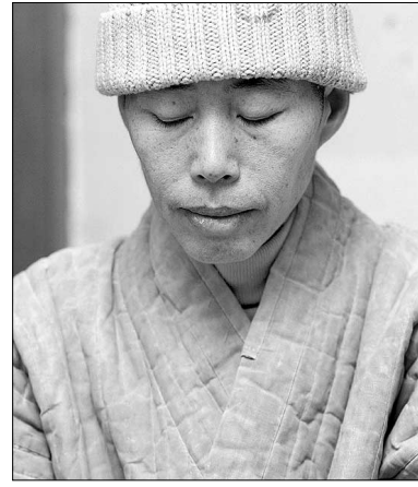
상태로 단식을 그만둔다는 것은 있을 수 없다. 지금 몸은 힘들지만 마음은 편하다. 어려운 조건에서도 찾아와준 사람들에게는 고마움을 전하고 싶다. 당분간은 천성산 문제에 대해 좀 더 정리를 할 생각이다. 우선은 ‘초록의 공명’ CD를 보급하는 것에 역점을 둘 계획이다.

안하는 것은 말도 안 된다. 그리고 이것은 자신들의 잘못을 인정하는 처사다. 잘못된 것이 얼마나 많으면 소리 없이 일을 꾸미겠는가? 다시 한번 강조하지만 지금처럼 공사는 공사대로 하면서 환경영향평가를 운운하는 것은 인정할 수 없다. ▲시민환경단체들의 반응은 어떠한지. -오늘 오전에 환경단체 실무자로부터 전화가 왔다. 단체대표자들이 기자회견을 열어 문제해결을 요구하겠다고 했다. 그러나 이러한 기자회견은 원치 않는다. 2심에서 각각 결정이 났을 때, 뽀뽀이 흩어졌던 단체들이 이제 와서 다시 뭉 하겠다고 하는지 모르겠다. 당분간 그냥 있어 줬으면 좋겠다. ▲단식이 길어지면서 걱정하는 사람들이 많다. -제대로 된 환경영향평가속이 없는