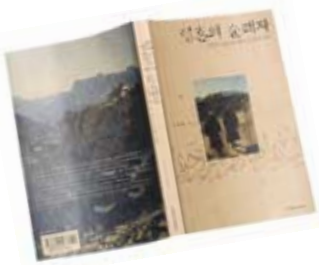
영혼의 순례자 조연현 지음 | 한겨레신문사 펴냄 | 9천5백원