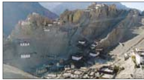
티베트 스피티의 고산지역에 위치한 당카르의 절들.

이 책은 일종의 인도 오지 체험 기행문이다. 지은이는 각 종교의 주요 사원을 돌고 그곳에 있는 성직자들을 만나면서 힌두교 불교 자이나교 시크교 등의 역