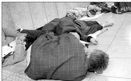
사회 한쪽에선 각종 비만 관련 상품이 날개돋친 듯 팔리나지만 거리의 노숙자는 늘어만 간다.

보내고 있다. 환경부는 지난해동안 자치단체와 전국의 유역(지방)환경청에서 897건의 환경관련 범죄를 적발했다고 지난 12월 밝혔다. 자치단체에서는 268건이 적발돼 지난해(221건)보다 21.3%가 증가했으며 유역환경청의 적발건수는 629건으로 지난해(561건)에 비해 12.1%가 늘었다.