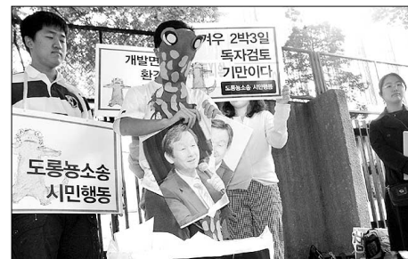
2003년에 비해 2004년 유역환경청의 환경관련 범죄 적발은 12.1% 늘었다. 사진은 천성산 살리기 집회 장면.

여러 가지 대안 중 박경준 교수는 '교육' 분야에 초점을 맞추고 불교계 NGO들의 활동 및 연대 강화에 방점을 뒀다. 박 교수는 이상사회로 들 수 있는 '불국토 건설'을 위해선 여립 때부터 불교계 가르침을 체화시킬 수 있는 정신적 물질적 토대 마련 마련이 중요하다고 강조했다.