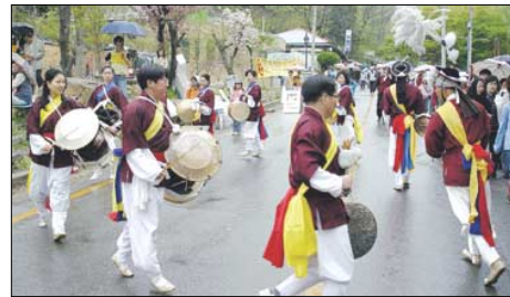
평화실천 불교연대 창립 1주년을 맞아 진행된 기념행사.

"1사찰 1복지 시대가 왔으면 한다"는 이 부관장에게 복지는 25년 이어온 불교와의 인연을 회향하는 수행의 장이자 복을 일구는 발이다. 이 부관장은 "남은 생 동안 부처님의 자비사상을 복지현장에서 실현하며 복덕을 쌓아서 다음 생엔 말 한마디, 행동 하나로 많은 이들을 제도할 수 있는 출가수행자가 되고 싶다"고 큰 욕심을 내비쳤다. 천미희 기자