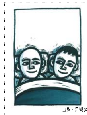
그림 · 문병성

인심 좋은 어느 농가에 들러 저녁도 얻어먹고 허룻밤 잠자리도 얻어볼까 하다가 그만 포기했다. 심신이 지치기도 했지만 혹여 그의 정을 들어주지 못할 경우를 상정해서였다. 그리되면 그 자신이나 그 농가가 얼마나 난처할 것인가. 어두워가는 저녁녘에 찾아 온 김손을 먹여주고 재워주지 못하는 농가 주인이나 그 농가를 뒤로 하고 떠나는 김손의 뒷모습은 또한 어떠한 것인가.