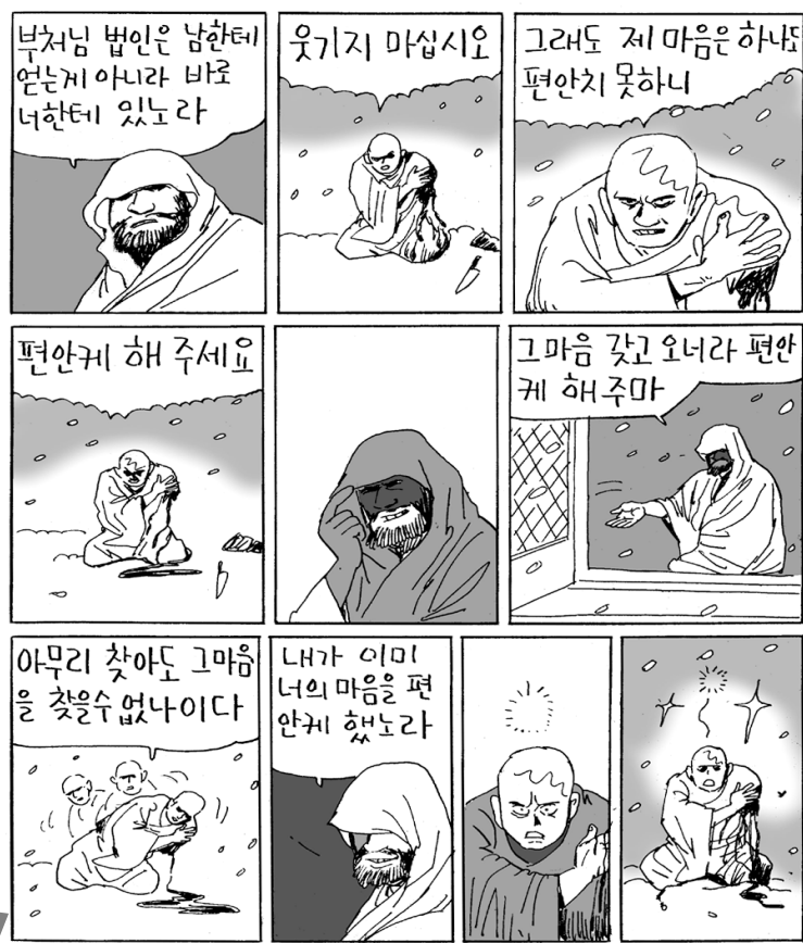
혜가(487-593)스님: 중국 선종의 제2조. 어려서 향산사 보정선사에게 출가 했으나 나이 40에 달마를 찾아가 전법을 받았다. 득도후 만행하며 자유자재의 삶을 보였다.