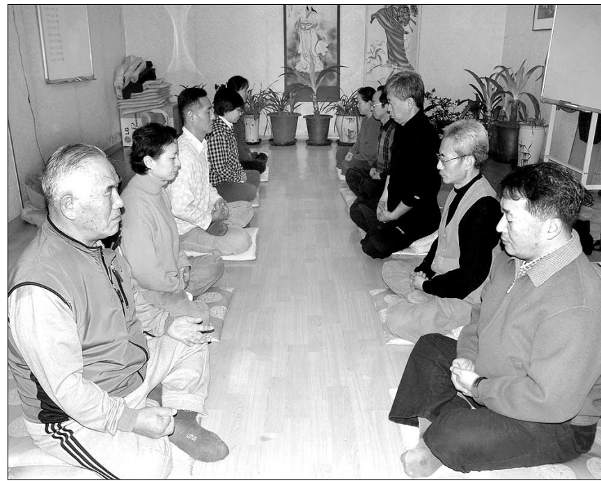
서울 정릉 보림선원 재가불자들이 12월18일 선원에서 열린 철야참선에서 정진하고 있다.

죽비소리가 침묵을 깬다. 2시간 좌선 끝에 10분간의 포행, 선방을 돈다. 두 손을 배 밑에 포개 대고, 굳은 어깨를 주스러 본다. 하지만 화두는 놓지 않는다. '빛깔도 소리도 냄새도 없는 이 높은 무엇인가'를 의심하고 또 의심한다. 그리고 다시 좌복에 침묵이 내려앉는다.