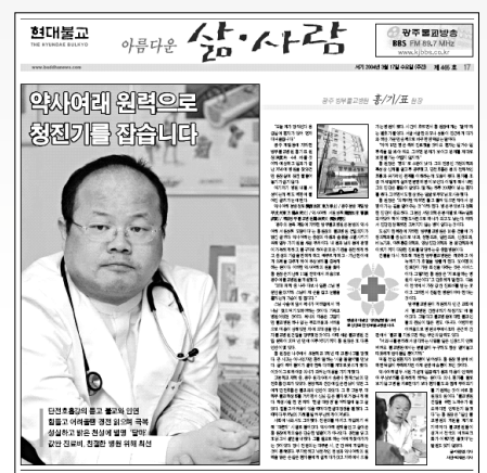
현대불교신문 465호(2004.3.17) 게재