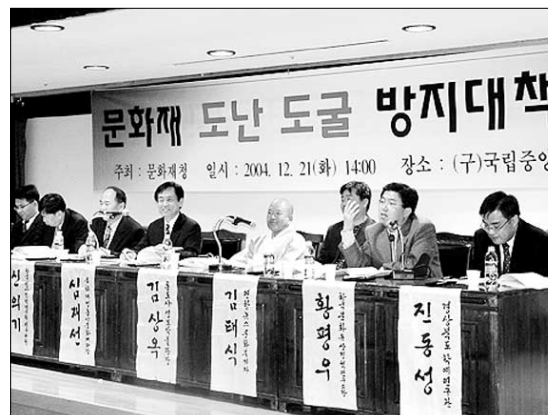
문화재 도굴·도난 방지를 위해 학계·박물관계 전문가들과 검사가 머리를 맞댔다.

또 도굴 문제와 관련 신 연구위원은 “우리나라 동산문화재의 상당수를 차지하는 매장 문화재는 90% 이상을 도굴범이 발굴했다는 주장이 있을 정도”며 도굴의 심각성을 제기한 뒤, “문화재 매장 가능 지역 조사와 체계적인 발굴 계획이 시급하다”고 주장했다.