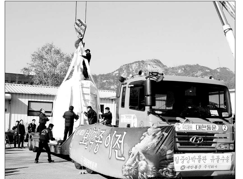
한지와 소창으로 포장된 종은 무진동 저장차량에 싣고 있다.