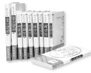
불교 경전 시리즈 해설출판사 전 10권 각권 1만원