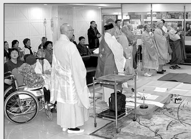
방부불교병원에 입원 중인 스님들이 12월 5일 불교병원 발전을 위한 법회를 열고 있다.

경영남으로 위기에 처한 불교병원을 살리기 위해 지역 스님들이 발벗고 나섰다. 광주 방부불교병원에 입원중인 스님 10여명은 12월 5일 병원 1층 로비에서 '불교병원발전과 환자 쾌유를 위한 천도제'를 봉행했다.