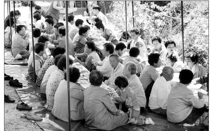
지난 10월에 백운사에서 열렸던 마을 어르신 위안잔치 모습. 백운사는 해마다 경로잔치를 여는 등 마을 사람들의 휴식처 역할을 하고 있다.

충북 옥천군 청산면에서는 유일한 사찰인 백운사. 어린 아이 할 것 없이 이 마을 사람들에게 백운사는 사찰이 라기보다는 휴식처다. 50년 전 절이 생길 때부터 그랬다. 마을을 먹여야만 가게 되는 곳도 아니고, 그렇다고 1년 내내 가지 않더라도 이상할 것 없는 쪽 이웃집 같은 곳. 청산면 사람들에게 백운사는 그렇게 따뜻한 곳이다.