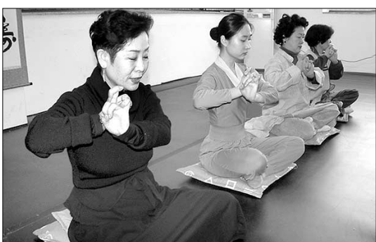
동작에 화두를 실은 선무명상은 행선을 병행시킨 명상법으로, 건강·수행을 동시에 행하려는 대중들로부터 인기를 모으고 있다.

그러나 급작스럽게 퍼져버린 명상문화의 한켠에는 어두운 그림자가 짙게 드리우고 있다. 상업화된 정신문화가 벌여낸 '혼탁한 공기'를 정화하는 것 역시 핵심 과제로 떠올랐다. 순종과 함께 양초를 만난 2004년 명상계를 결산한다.