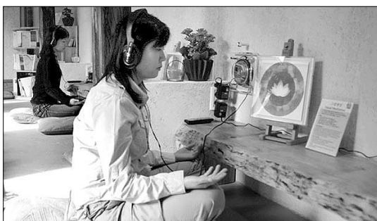
인사동 '명상이아리 선'에서 그림명상에 몰입하고 있는 사람들. 명상이아리 선은 올해 40여개 센터를 열었다.

명상편의점 등 대중화...질적 수준은? 2003년 11월 19일 서울 광화문에 명상편의점이 들어서면서 명상문화는 대중적 관심을 모으기 시작했다. 선도명상 수련단체 수천개의 자매단체격인 '명상편의점'과 '명상이아리 선(仙)'의 명상법은 "편의점에 들려 물건을 사듯 손쉽게 명상을 할 수 있다"는 언론의 대대적인 홍보에 힘입어 빠르게 확산돼 갔다. 광화문, 인사동을 중심으로 확장활동을 벌여온 단체는 그림명상, 감각 명상 등의 손쉬운 명상법을 지도하며 현재 40여개의 명상편의점·명상카페·명상센터 등을 운영하고 있다.