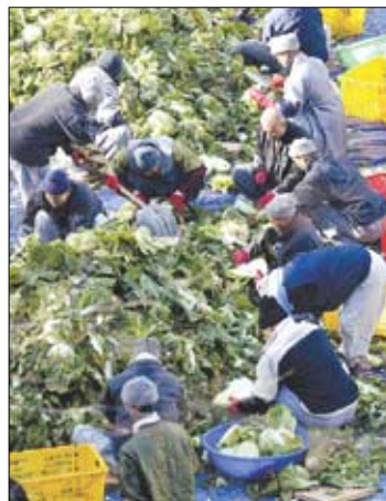
배추와 무 씻기