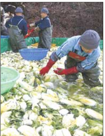
절인 배추 물에 헹구기