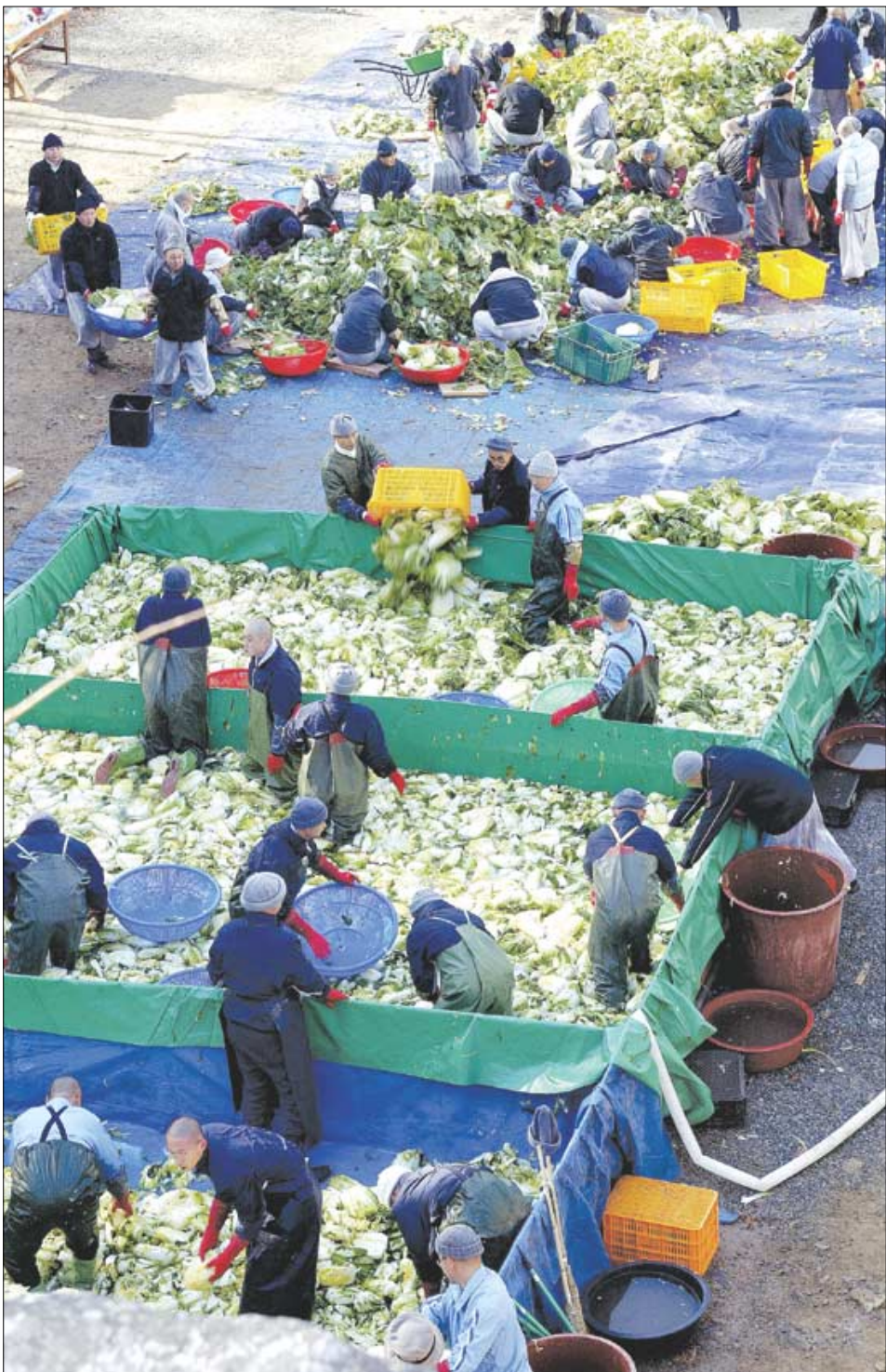
수영장처럼 넓은 대형 간절임통이 만들어져 이곳에서 배추가 소금물에 절여진다.