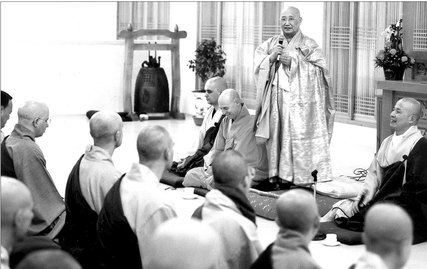
승산 스님은 해외포교 35년 만에 전 세계 32개국에 120여곳의 흥법원을 개설하고 5만여 남자와 제자를 두었다. 사진은 2001년 무상사 동안계 결계법회에서 스님이 제자들에게 큰 권력을 세우고 열심히 수행하 것을 당부하고 있는 모습.

62년 조계종 비상종회의장과 통합종단 비상종회 초대 의장을 역임한 뒤, 스님이 조계종 총무부장 소임을 맡고 있을 때였다. 동국대 기숙사를 짓기 위해 공사를 하던 중 지하에서 일본인 유골이 무더기로 발굴됐다. 스님은 유골을 화계사에 안치했고 이 소식이 일본에 알려지면서 일본 불교계 초청으로 도쿄를 방문했다. 이를 계기로 부처님 자비정신을 세계에 알려야겠다고 결심한 스님은 도쿄에 흥법원을 개설한 뒤 69년 홍콩, 72년 미국에 흥법원을 열면서