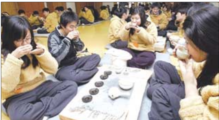
지난해 파라미터 청소년협회가 주최한 겨울수련회에 참석한 청소년들이 다도체험을 하고 있다.

겨울수련회 시즌이 돌아왔다. 전국의 사찰과 불교단체들은 12월부터 내년 1월까지 방학을 맞은 학생들과 성인들을 위한 '신나는 불교학교' 겨울수련회를 열고 있다. 예를 좌선 산행 독경 등 전통 불교식으로 진행되는 코스도 있고, 철새를 관찰하거나 겨울 자연생태계를 살펴보는 환경교실도 있다. 어린이들을 위한 스키 캠프, 눈썰매 교실 등 눈길을 끄는 행사도 마련했다. 강유신 기자