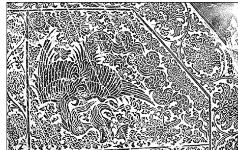
선봉사 대각국사비 상단부분의 봉황무늬.

"금석문 탁본이 얼마나 아름다울 수 있을까?" "물에 새긴 역사, 먹으로 떠낸 여운" 주제의 금석문 탁본전이 12월 1일부터 26일까지 김천 직지성보박물관 전시실에서 개최된다. 이번 전시회는 직지성보박물관장 흥선 스님이 경북지역에 전해 내려오는 금석문의 자료를 수집해 정리한 것 중 가장 섬세하고 아름다운 작품 70여점을 골라 공개한 것이다. 봉암사 지증대사 적조탑의 부도 탁본 등은 한국 불교 미술 문양의 아름다움을 선보이는 작품이다. (054) 436-6009