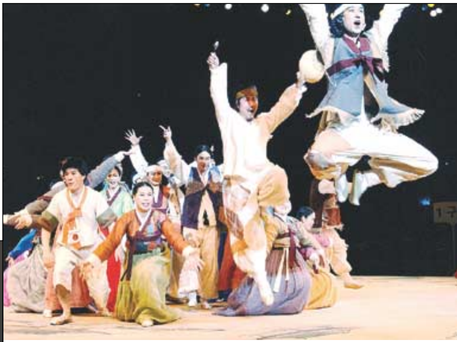
마당놀이 '제비가 기가 막혀'는 놀부와 흥부형제를 현대사회의 물질만능주의를 풍자한다.