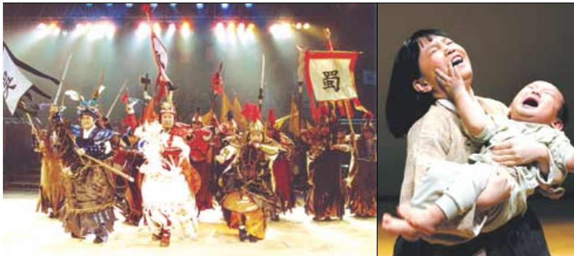
역경을 딛고 굳세게 살아가는 어린이를 주인공으로 한 '몽실언니' (우)와 동양고전 삼국지에 바탕을 둔 마당놀이 '삼국지' (좌)의 한 장면.