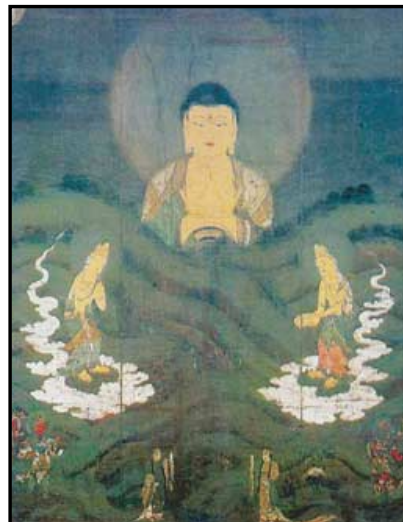
가마쿠라시대에 제작된 일본불화 '아미타도'.