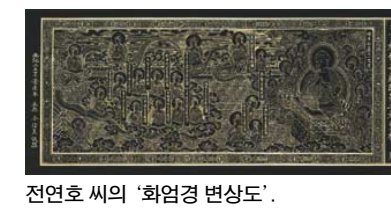
전연호 씨의 '화엄경 변상도'.