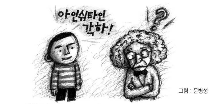
그림 : 문병성