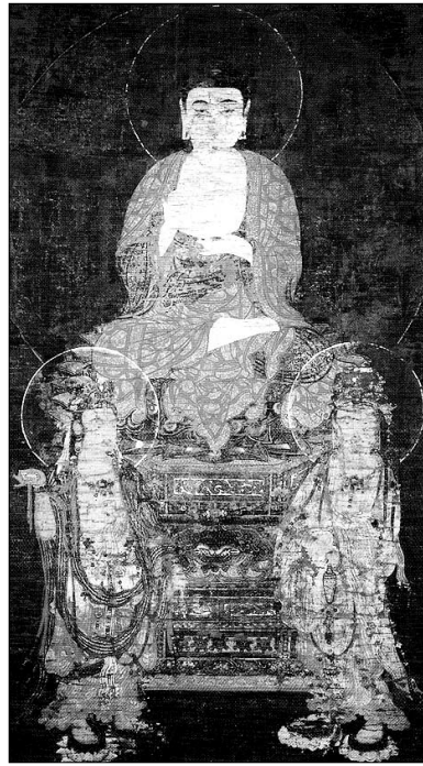
절도범이 반입한 '아미타삼존도'. 반환여부가 초미의 관심사로 떠오르고 있다.

문화재를 돌려받는 방법은 기증, 구매 등이 있는데, 지금까지 공식적으로 환수된 우리 문화재는 5천여 점에 불과하다. 1994년 9월 김영삼 대통령과 미테랑 프랑스 대통령 사이에 '고속철도'를 계기로의 규장각 고문서 반환에 대한 합의가 이뤄졌지만, 10년이 지나고 고속철도가 달리