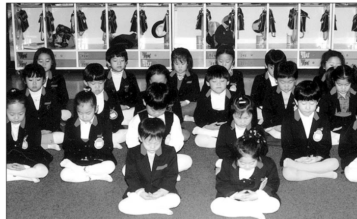
송화사 불교유치원 어린이들이 침선공부를 하고 있는 모습. 제천에서 유치원과 어린이법회를 운영하는 사찰은 송화사가 유일하다.

송화사는 제천 포교 1번지로서, 지역 불교의 발전을 이끌어 온 선진과도 같은 곳이다. 송화사는 1973년 창건과 함께 곧바로 고등부 학생회를 만들어 청소년 포교에 뛰어들었고, 어린이와 중등부 학생회도 연이어 창립해 전국 어디에 내놓아도 손색이 없을 정도로 학생회를 운영해왔다. 뿐만 아니라 신도회 거사회 합창단 등을 통해 지역 불심을 규합하는데 선도적인 역할을 했다. 또 시내에 ‘진여원’이라는 포교당을 개설, 제천포교에 박차를 가하면 서 제천 유일의 불교유치원(법회유치원)을 운영하고 있기도 하다. 그리고