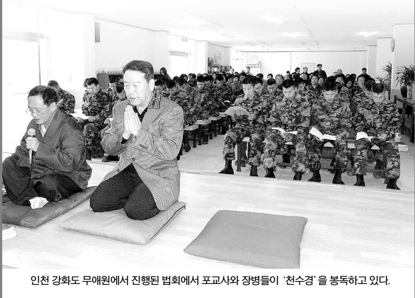
인천 강화도 무애원에서 진행된 법회에서 포교사와 장병들이 ‘천수경’을 봉독하고 있다.