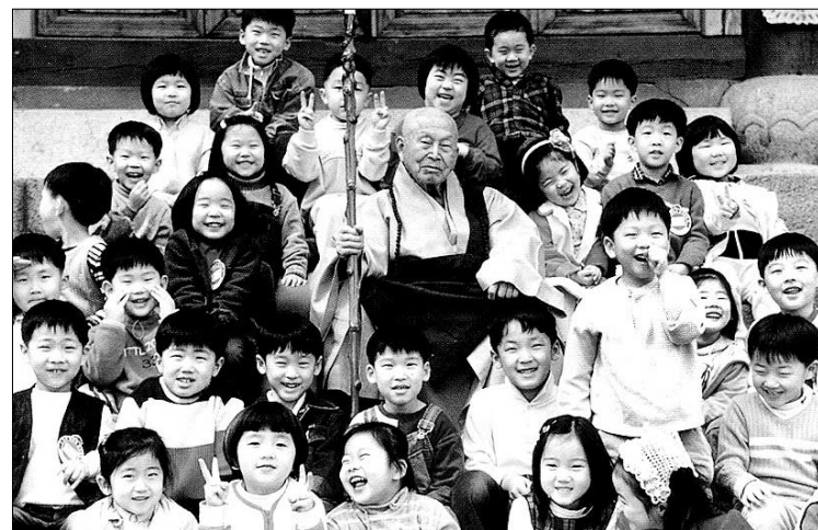
스님은 평소 "한국불교의 장래는 어린이와 청소년을 불자화하는 데 있다"고 늘 얘기할 정도로 어린이들을 유난히 아끼셨다. 철보유치원 어린이들과 함께 한 석주 스님.

오늘 아침 무거운 짐 내던지니(負今朝放下煩重) 옛 모습 오듯이 본 고향이구나(本地風光古如新) "자비원력보살" (서운 스님) '천하를 사랑하는 이' (범룡 스님) '인과 밖이 여여하신 자비보살' (관음 스님) '살 자체가 바로 법문인 분' (도원 스님). 현대 한국 고승들이 석주 스님을 평한 것처럼, 스님은 원적에 들기 전 제자들에게 이렇게 말씀했다. "부처님 열반경이 임종계이거늘 어찌 임종계를 남기겠는가. 사리도 수습하지 마라." 글=천미희·남동우 기자