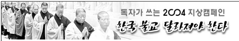
독자가 쓰는 2004 지상캠페인 한국 불교 달라지야 한다