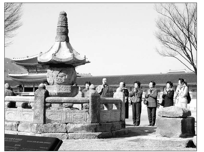
봉인사 신도들은 매달 음력 초하루엔 경복궁 뜰에 있는 보물 제928호 봉인사부도암사리탑을 찾아 탑돌이를 하며 이 탑이 봉인사로 돌아오기를 기원한다.

이 같은 봉인사 측의 반환 요구에 대해 박물관은 “이와다센소 씨는 봉인사가 아닌 대한민국 정부에 대해 기증했다”며 “현 봉인사가 옛 봉인사 절터에 세운 절이라 해서 사리탑 조성 당시의 소유