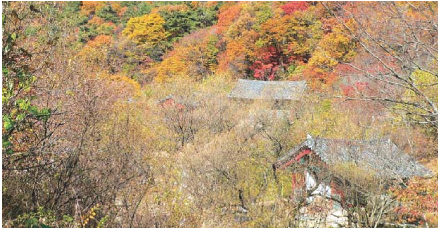
숲 속에 살면서도 나무 다루기를 천금같이 해온 옛 스님의 근검절약 정신을 느낄 수 있는 각연사 비로전 기둥(왼쪽)과 단풍이 절정인 10월 각연사의 모습(오른쪽).