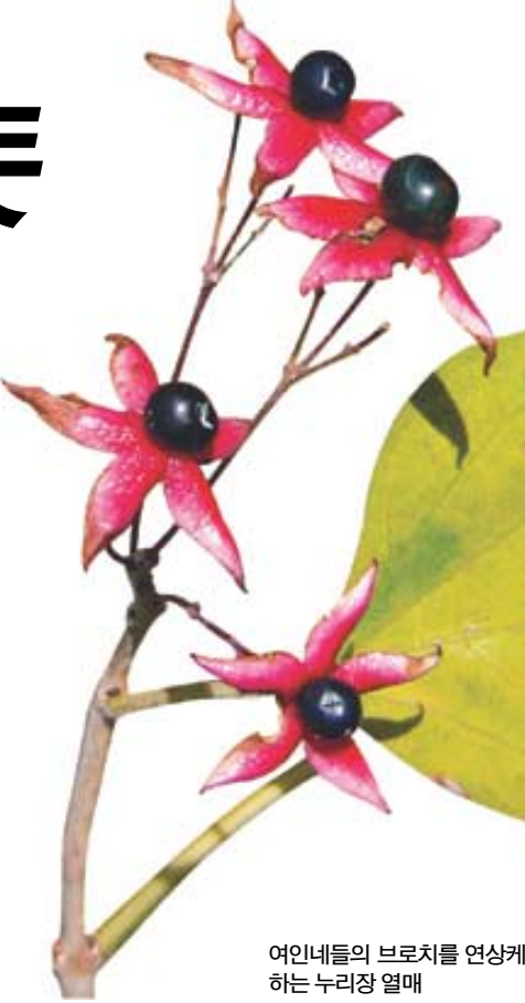
여인네들의 브로치를 연상케 하는 누리장 열매

각연사는 신라 법흥왕 때인 515년에 유일화상이 창건했다고 전한다. 그러나 515년이라면 법흥왕이 즉위한 다음 해, 이차돈이 순교하기 훨씬 전의 일이니 신빙성이 크게 떨어지는 전설이다. 대웅전 앞마당에 네발나비와 빨나비가 여기저기 날아 있었다. 이들은 흙 속에 들어 있는 미네랄을 씹어먹는 중이다. 몸속에 영양분을 충분히 비축해두어야 겨울을 날 수 있다. 산에 들에 단풍이 들면 곤충의 제왕인 왕사마