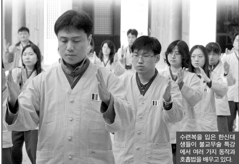
수련복을 입은 한신대생들이 불교무술 특강에서 여러 가지 동작과 호흡법을 배우고 있다.