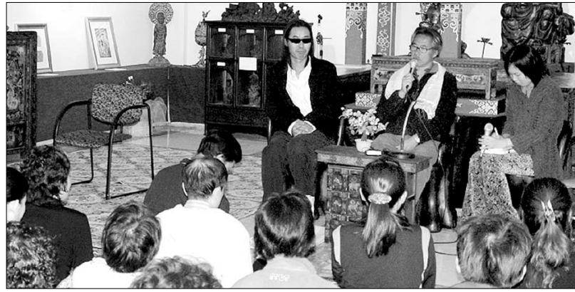
달라이 라마의 '용서'를 저술한 빅터 찬 교수가(가운데)가 11월 3일 보성 대원사를 찾아 한국의 불자들에게 달라이 라마의 특별 메시지를 전했다.

시화 시인의 초청에 따른 것. 홍콩출신 중국계 캐나다인인 빅터 찬은 현재 캐나다 콜롬비아 대학 동양학 연구소 교수다. 빅터 찬은 달라이 라마와의 첫 만남을 "영광한 시간에 영동한 장소에 있었기 때문이다"며 독자와의 대화를 시작했다. 그는 1972년 대학 졸업 후 떠난 세계 여행길에서 달라이 라마를 친견하게 됐다. 빅터 찬은 달라이 라마가 인도 망명 후 13년만에 만난 첫 중국인이었다. 이렇게 시작된 우정은 30여년이 지난 오늘까지 계속되고 있다. "달라이 라마는 모든 존재가 연결되어