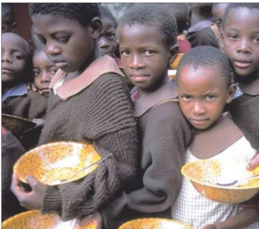
점심식사를 타기위해 순서를 기다리는 짐바브웨 초등학생들.