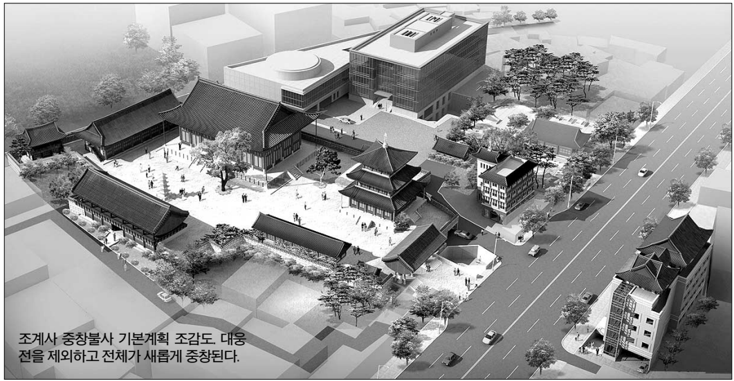
조계사 중창불사 기본계획 조감도. 대웅전을 제외하고 전체가 새롭게 중창된다.

조계사(주지 원담)가 일반시민들의 신행·교육·수행의 공간 뿐 아니라 다양한 전통문화를 체험할 수 있는 문화복합공간으로 거듭난다. 이를 위해 조계사는 현재 진행 중인 대웅전 보수공사를 내년 말까지 마무리하고 일주문과 만불보전, 보제루, 문화사입관 신축 등 2008년까지 250억 규모의 중창불사를 진행할 계획이다. 또한 조계사와 인사동을 잇는 지하도 건설을 통해 경복궁과 인사동 등 인근지역을 문화벨트로 조성해 외국인 관광객을 비롯해 일반시민들의 발길을 자연스럽게 조계사로 이끌 방침이다.