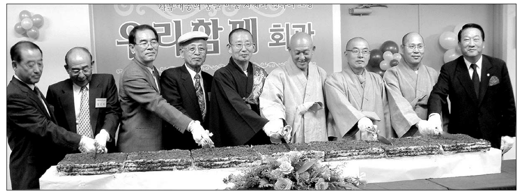
10월 30일 열린 '우리함께' 회관 개원식에서 축하 떡을 썰고 있는 참석자들과.

신교와 가톨릭은 각각 5,500여 명, 4,600여 명의 증가, 자원봉사자 증가율도 상대적으로 뒤처지는 것으로 분석됐다. 그러나 봉사자 1인당 한해 평균봉사시간은 불교가 36.8시간으로 개신교 28시간, 가톨릭 33.1시간에 비해 상대적으로 높았다. '2003 사회복지 자원봉사 통계연보'는 전국 사회복지시설 및 단체 1,585개소 중 사회복지봉사활동 인센티브로 지정되어 활동 중인 자원봉사자들을 대상으로 설문조사한 결과이다. 김은경 기자