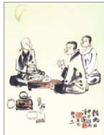
차를 즐기는 다인들을 그린 김창배 화백의 작품.

김창배 화백이 '차&예술센터' 개관을 기념해 마련한 이번 전시회는 차와 차를 즐기는 다인들의 모습을 그린 작품 30점을 감상할 수 있다. 조선시대 대표적 화가인 단원 김홍도의 후손인 김창배 화백은 중국 북종화의 대가 금주 이남호 선생의 수제자다. (02)736-7445 강유신 기자