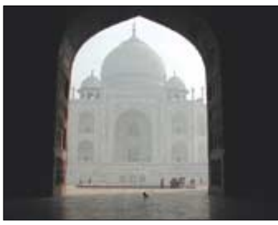
인도의 대표적인 건축 '타지마할' 사진.

불교문화연구원 주최로 열리는 이 전시회에 선보이는 작품들은 지은 스님이 2002년부터 티베트와 인도, 네팔 등지를 순례하며 찍은 사진 백여 점. 지은 스님은 "내년에는 몽골과 중국 등지의 사진을 중심으로 전시회를 마련할 계획"이라고 말했다. (053)650-0221 배지선 기자