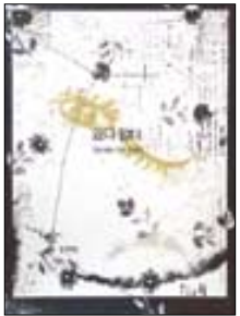
있다·없다-다시 쓰는 가족이야기 연세대, 하자 작업장 학교, 홍익대 학생 지음 안그래픽스 | 2만원