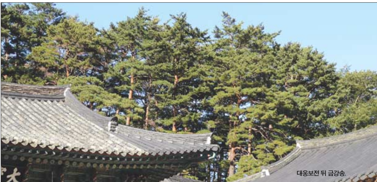
대웅보전 뒤 금강송.

글·사진=김재일(사찰생태연구소장) http://cafe.daum.net/templeeco