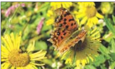
불영교 건너편 숲속의 네발나비.

목본류로는 몇 종류의 참나무를 비롯해 밤나무, 산뽕나무, 왕버들, 오리나무, 쪽동백, 단풍, 산초나무, 불나무, 산수국, 국수나무 등이 잡목숲을 이루고 있다. 아까시나무도 몇 그루 들어와 있다. 그런 가운데 아름답게 금강송들이 장정들처럼 여기저기 군락을 이루고