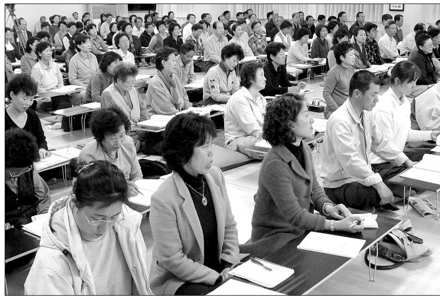
3백여 재가자들이 고우 스님에게 <선요> 강의를 듣고 있다. 사진=배지선 기자

“달마와 부처의 자리도, 달을 가리키는 손가락도 쳐내라 했습니다. 철저한 자기 부정이 바로 선입니다. <선요(禪要)>를 쓴 고봉 스님은 이를 여러 곳곳에서 강조하고 있습니다.” 고우 스님(봉화 각화사 선덕)은 주관과 객관을 나눠 보는 ‘이원적 사고’부터 마음에서 세력해 내라고 말했다. 그래서 선(禪)은 부정의 연속이고, 이런 과정에서 본래 자기 존재가 부처임(本來成佛)을 깨닫게 된다고 강조했다. “죽어야 비로소 살 수 있다”는 이치, 그 원리를 밝힌 것이 바로 <선요>의 핵심이라고 설명했다. 10월 28일, 불교TV 대구지사 무상사에서 사부대중 3백여 명이 참석한 가운데 열린 <선요> 특강. 고우 스님은 출가 수행자뿐만 아니라 재가자들에게 <선요>는 선수행의 필수서라고 법문