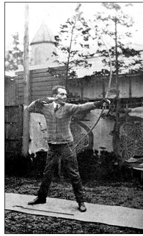
독일의 철학자 오이겐 헤리겔(Eugen Herrigel, 사진 왼쪽)과 일본 궁도의 명인 아와 겐조(阿波研造, 1880~1939)가 활을 쏘는 모습.

또한 스승은 “활쏘기에 이르는 길은 마음이 순수하고, 활쏘기 외에는 잡념이 없는 사람들에게만 열리게 마련”이며 “활을 쏠 때는 쏘는 사람 자신도 모르게 쏘아야만 흔들림이 없다”고 말한다. 무심(無心)의 상태에서 ‘합