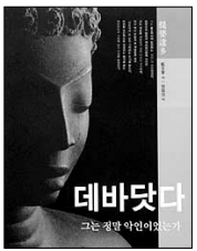
데바닷다, 그는 정말 악인이었는가 란지푸 지음 | 원필성 옮김 윤주사 | 8천원