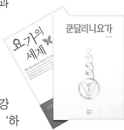
요가의 세계 쿤달리니요가

도, 요가의 사상과 본질을 접하게 되면 상상 이상으로 넓은 세계를 만날 수 있다고 말한다. 그리고 건강 체조로 대표되는 ‘하타요가’에만 익숙한 이들에게 소리의 힘을 응용한 만트라 요가, 성에너지의 전환인 탄트라 요가, 요가에서의 가장 높은 각성을 의미하는 쿤달리니 요가 등을 설명하며 영적 여행의 총괄적인 ‘삼매’와 그 종류를 얘기하고 있다. 그렇다고 까다로운 철학서를 상상할 필요는 없다. ‘힌두신이 거주하는 사원’으로서의 ‘육