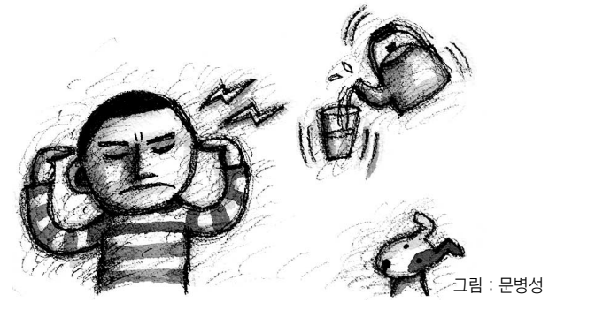
그림 : 문병성

서로 영향을 주고받으며 상존한다는 점이다. 반야심경에서의 오운개공(五蘊皆空)이라는 말처럼 과학이 다루는 식(識)이란 오직 변화하는 관계로 나타날 뿐 실체가 없다. 따라서 우리는 삼계유식(三界唯識)이란 표현처럼 정신과 물체라는 이분법적 사고를 뛰어넘어 실제로 없기에 실제로 나타나는 이 세상의 연기적 관계성(依他起性)을 바탕으로 하고 교류할 수 있는 정도로 증폭시키고 이 증폭된 전기적 신호를 무선으로 보내고 받아들일 수만 있다면 생각으로 휠체어를 움직이는 것도 가능하다. 현실적으로 생체 내에서 뇌의 전기적 신호에 따라 움직이고 있는 우리의 수족과 같은 원리로서 거리만 떨어져 있다 뿐이지 동일한 기능을 할 수 있는 물체를 지닐 수 있기 때문이다. 한편, 여기서 말하는 정신작용은 불