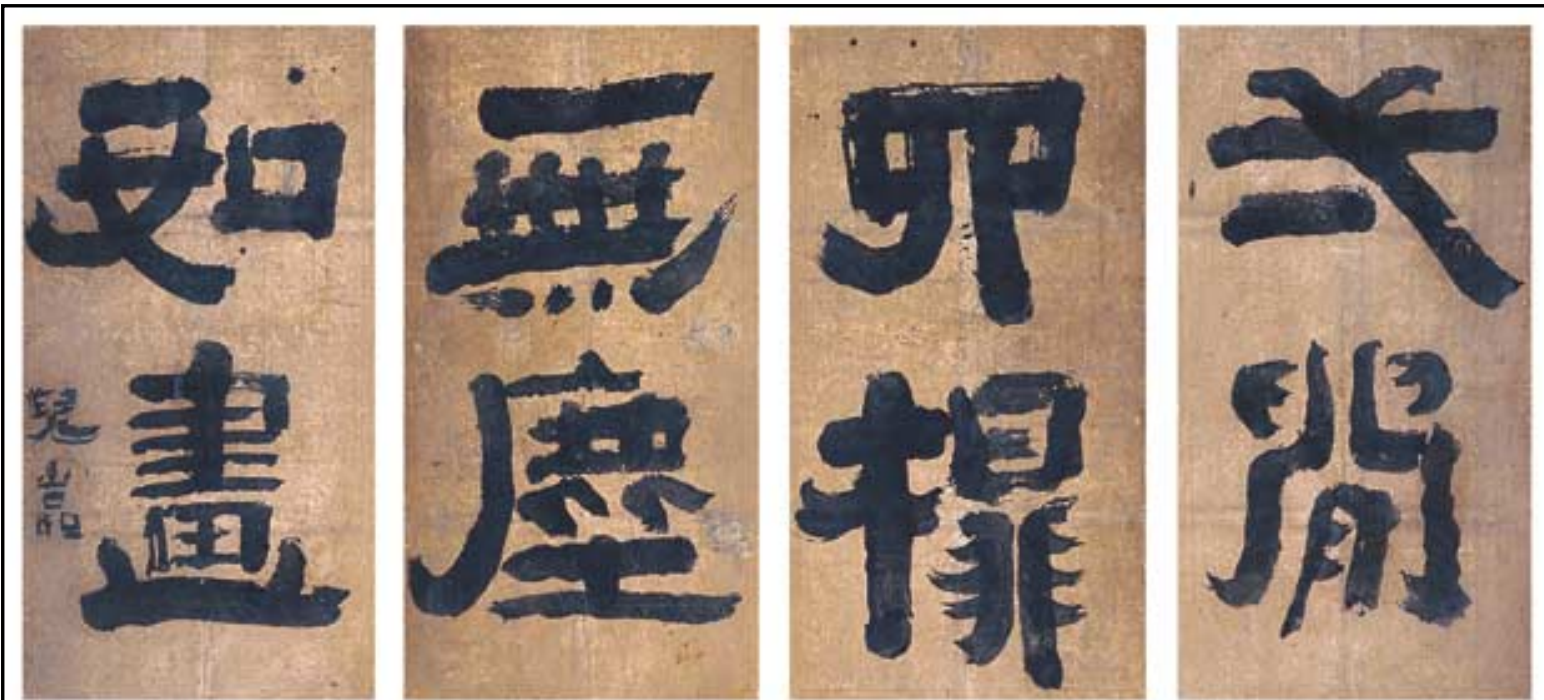
아함 혜장 스님의 '일한사탑 무진여화(一閼四榻 無塵如畫)' (동예현 소장).