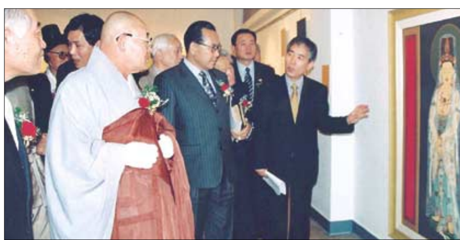
지난해 열린 대한민국 종교예술제 미술제에서 조계종 총무원장 법장 스님(사진 왼쪽)이 행사 관계자의 설명을 들으며 '관음보살도'를 감상하고 있다.