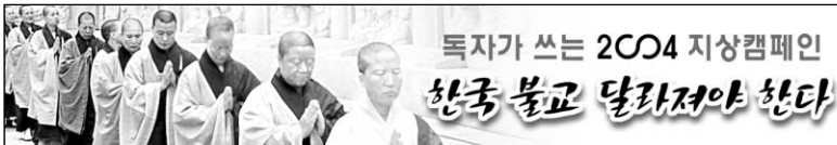
독자가 쓰는 2004 지상캠페인 한국 불교 달라져야 한다