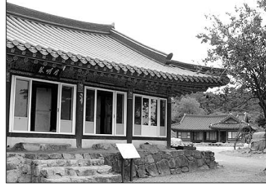
부안 월명암이 소장하고 있는 <부설전> 원본(위). 부설 거사가 창건한 부안 내소사 월명암(아래).

겨간다. 출가한 등운과 월명은 부설 거사가 창건한 묘적암에 등운암, 월명암 토굴을 지어 위법망구(佛法忘瞞) 정진 끝에 대성득도한다.