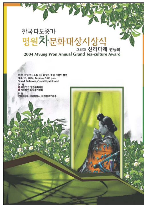
명원차문화대상시상식 / 날짜 : 10월 19일(화) 오후 5시 장소 : 하얏트 호텔 그랜드 볼룸