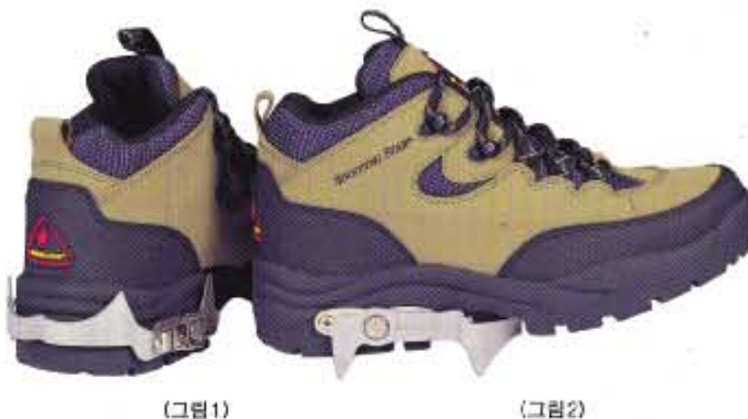
(그림 1) (그림 2)

눈, 비 올 때와 하산할 때 최고 등산화의 새로운 혁명이 시작되고 있다. 산을 좋아하는 매니아들은 매년속에서 아이젠 미끄럼 방지 기능을 비상용으로 향상시키고 있다. 그러나 이젠 이러한 불편함을 없애는 아이젠이 부착된 ‘등산화 썬스타’의 발명으로 등산매니아들로부터 각광을 받고 있다. 겨울이 아닌 앞만 계절에도 하산할 때에는 항상 위험이 따르고 심혹하는 경우가 빈번이 일어나고 특히 여름 산행은 갑작스런 소나기로 등산길이 대단히 미끄러워 아이젠은 등산을 하는 사람들에게는 필수품이다. 아이젠 등산화 썬스타는 신발 밑창 뒷부분에 강판하게 고정되어 그림)다기 미끄러운 곳을 지난 때에 간편하게 레바만 돌리면(그림2)이 있는곳이나 발판이 또는 비올 때에 안전하게 걸을 수 있도록 고안되었으며 아이젠을 간단히 빼었다 붙였다 할수도 있다. 세계적 권위를 가진 제네바 발명대회에서 국내 최초로 특별상을 수상했다. 이 신발은 기능성도 최고지만 최첨단 신소재가 총동원 된 등산화로 신는 순간부터 제2심장이란 발바닥 용전을 지압해 장시간 보행에도 피로감이 없고 최상의 컨디션을 유지시켜 주는 기능성 신발 과학의 결정체로 평가하고 있다. 아이젠 등산화 썬스타를 발명하고 개발한 (주)테레크는 관세음의 계절에 관계없이 등산에는 꼭 필요한 안전장비라고 강조한다. 가격 125,000원 (080)555-3080