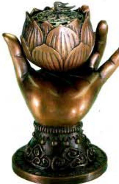
무게 2.7kg 높이 20cm 가로 17cm

추석 제례시 품위있게 사용! 불경에 일각한 범구를 원문으로 제작하는 관음예술원에서 불교의 관음 신앙에 등장하는 관세음보살의 엄정의 손모양과 자물을 향로로 제작해 장안불공과 축원 불공을 마치고 사랑하고 있어 화제가 되고 있다. 불교에서 관세음보살은 세상 모든 중생들의 소원을 성취시켜주는 영험을 담고 있으며, 실제로 관세음 박연하는 큰 스승들로 하여금 그라으로 그려져 어려움을 겪는 불자들에게 긴급 비방으로 사용해 왔다. 출시한지 100일도 안되어 관세음코살의 성상으로 어려운 사업장이 부도 우기를 넘기고 2년간 폐하기만 한 소중에서 승소하고, 어렵다고 생각한 이들이 S대화에 합격하고, 팔리지 않아 고민하던 부동산이 팔리는 등 관세음보살님의 영험이 나타나고 있는 소원성취 향로다. 특히 갑산년에 부처님 공양구를 7경에 코시면 심재도 소원되고 가격이 건강하고 화복하며 화를 쫓고 있었던 이들이 풀린대하여 인기를 끌고 있다. 관세음보살백연화 향로는 99% 청동만으로 국내에서 불경에 일각해 제작했으며 중국에서 씨게 만들어 들어오는 향로는 만들기 쉽게 합금을 하여 2~3년만 재탄화 회복력이 되고 부식되고 변질되지만 관세음백연화 향로는 천년이 지나도 변질되지 않으므로 기정의 변형과 인상을 지켜주는 기부와 수호신으로 가정에서 예불시 또는 제례시 사용하다 후손에게 물려줘도 손색이 없는 국보급 향로로 인정 받고 있다. 가격 25,000원 문의 (080-330-7555)