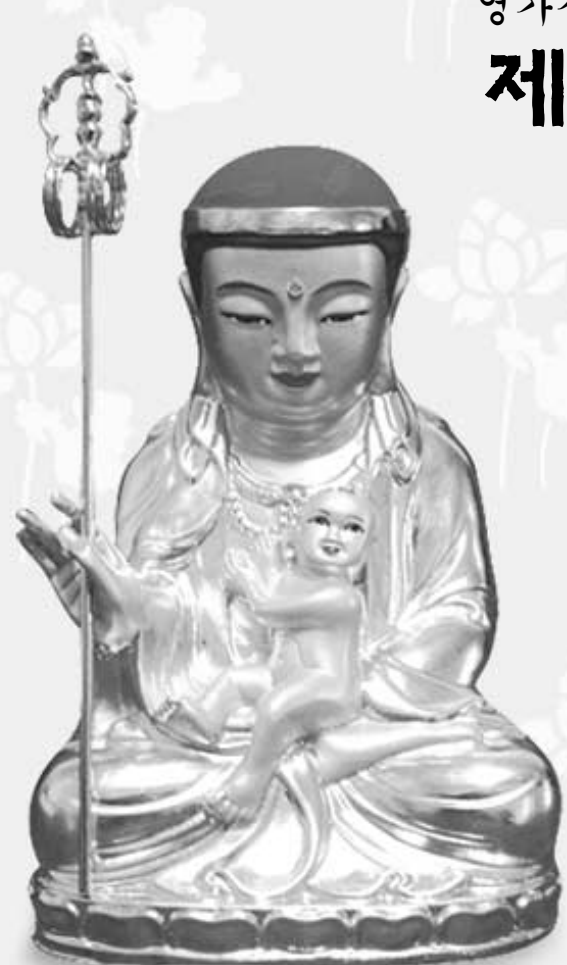
태중(낙태, 유산) 아기 지장보살님

태(胎)중 아기 지장보살님을 봉안하고 성심껏 기도하여 아기영가가 편안하고 업장소멸하기를 기원합니다.