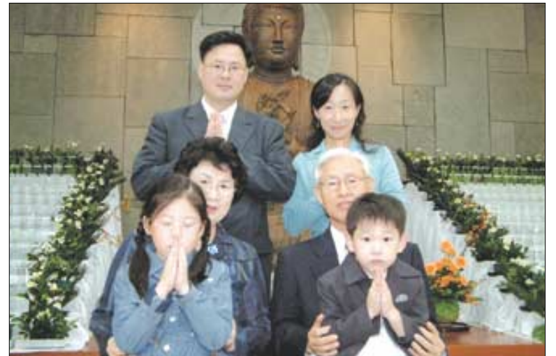
여래광 보살 가족 3대가 강남포교원 법당에 모였다.

현식(68·석우) 거사의 말이다. “경전공부”와 ‘보시행’은 아들 내외에게도 이어졌다. 당시 대학교 2학년이던 큰 아들은 팔을 걷어붙이고 법당 페인트칠을 손수 도맡아하는 등 청년회 활동을 열성적으로 하더니 결혼식 때도 성열 스님을 주례로 모셨다. 곧 무종교인이었던 아내도 수계를 하고 불자가 되었다. 아들내외는 아이가 태어나자 백 일째 아이 법명을 받기 위해 사찰에 들었다. 이제는 온 가족이 한 마음으로