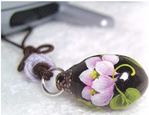
연꽃씨앗으로 만든 연실 핸드폰줄.

한달 여 앞으로 다가온 '인생의 관문' 앞에서 수험생들의 마음이 천국과 지옥을 오간다. 로또에서 나지 않던 대박이 그날 터질 것 같다가도, 일생일대의 실수가 그날 벌어지면 어쩔까 하는 마음에 좌불안석이다. '일체유심조'를 되뇌이지만 그 한마음 먹기가 그리 쉽지는 않은 법. 백일기도를 하루 거른 엄마가 갑자기 원망스러워지고, 생전 관심없던 불다붓은 부적에도 시선이 머문다. 이 마음 어떻게 잡아야 할지를 고민하는 이들에게 의지가 되는 불교문화상품들이 많이 나와있다. 입시를 앞둔 아들 딸이나 손자·조카, 친구들을 위한 선물로도 좋은 상품들을 소개한다.