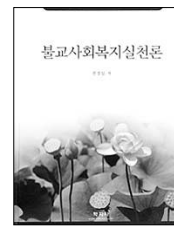
불교사회복지실천론 권경임 지음 학지사 | 1만5천원

일반사회복지학에 비해 불교사회복지학은 약 30년 정도의 짧은 역사를 지닌 학문으로, 체계적으로 정립되기 위해선 아직도 가야할 길이 멀다.