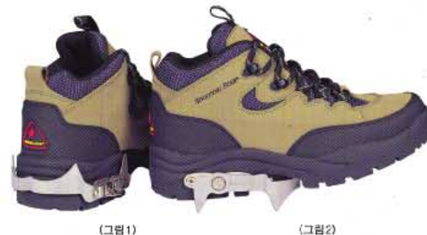
(그림 1) (그림 2)

눈, 비 올 때와 하산할 때 최고 등산화의 새로운 혁명이 시작되고 있다. 산을 좋아하는 매니아들은 매년속에서 아이젠 미끄럼 방지 기능을 비상용으로 향상시키고 있다. 그러나 이젠 이러한 불편함을 없애는 아이젠이 부착된 ‘등산화 썬스타’의 발명으로 등산매니아들로부터 각광을 받고 있다. 겨울이 아닌 앞만 계절에도 하산할 때에는 항상 위험이 따르고 심혹하는 경우가 빈번이 일어나고 특히 여름 산행은 갑작스런 소나기로 등산길이 대단히 미끄러워 아이젠은 등산을 하는 사람들에게는 필수품이다. 아이젠 등산화 썬스타는 신발 밑창 뒷부분에 강판하게 고정되어 그림)다기 미끄러운 곳을 지난 때에 간편하게 레바만 돌리면(그림)2)이 있는곳이나 빙판이 또는 비 올 때에 안전하게 걸을 수 있도록 고안되었으며 아이젠을 간단히 빼었다 붙였다 할수도 있다. 세계적 권위를 가진 제네바 발명대회에서 국내 최초로 특별상을 수상했다. 이 신발은 기능성도 최고지만 최첨단 신소재가 총동원 된 등산화로 신는 순간부터 제2심장이란 발바닥 용전을 지압해 장시간 보행에도 피로감이 없고 최상의 컨디션을 유지시켜 주는 기능성 신발 과학의 결정체로 평가하고 있다. 아이젠 등산화 썬스타를 발명하고 개발한 (주)테레크는 관세음의 계절에 관계없이 등산에는 꼭 필요한 안전장비라고 강조한다. 가격 125,000원 (080)555-3080