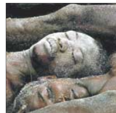
2003년 라이베리아 내전으로 살해된 흑인들 모습.