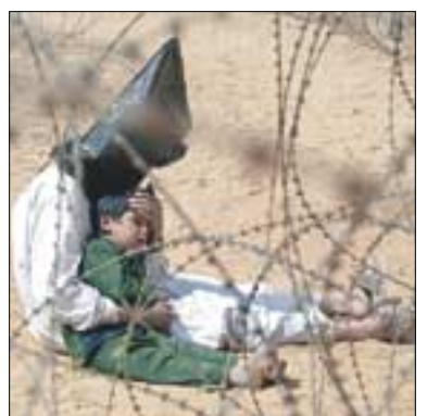
이리크 전쟁에서 포로가 된 아버지와 아들 사진.