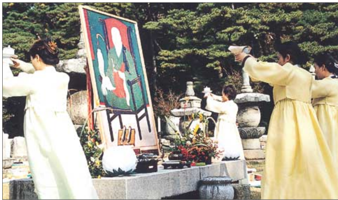
2001년 열린 통도사 개산대제에서 통도사 개산조인 자장율사 부도에 차를 올리는 모습.

교문화축전을 개최한다. 이번 행사는 부처님 진신사리 이운식, 만등 밝히기, 탑돌이 등 불교 전통문화행사와 오대산 사진 공모전, 청소년 사생 및 백일장 등으로 다채롭게 꾸며진다. 특히 지난 6월 체결된 한중 오대산간 불교교류 협정에 따라 열리는 '중국 오대산 사진전', '유물로 보는 문수신앙 특별전' 등도 관심을 끄는 행사다. 순천 송광사도 10월 23, 24일 양일