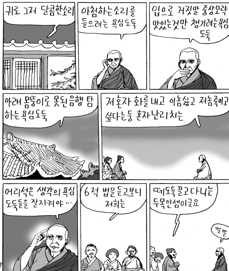
일연 스님(1206~1289): 고려 중기의 스님. <삼국유사>를 지은 것으로 유명. 9세에 설악산 진전사로 출가하여 교학과 선수행에 몰두. 1227년 승과에 합격. 군위 인각사에서 일컫.