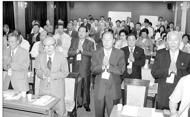
조계종 중앙신도회는 9월 4~5일, 통합이후 처음으로 열린 임원대회에서 고문 및 지도위원 77명을 새롭게 위촉했다.