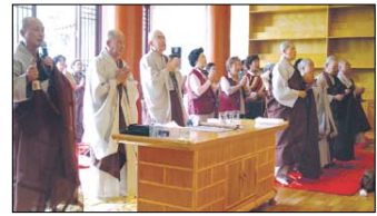
9월 2일 열린 개원법회.

신형근 한국칭따오 총영사관은 축하사에서 "칭따오는 지리적으로나 역사적으로 한국과 밀접한 관계에