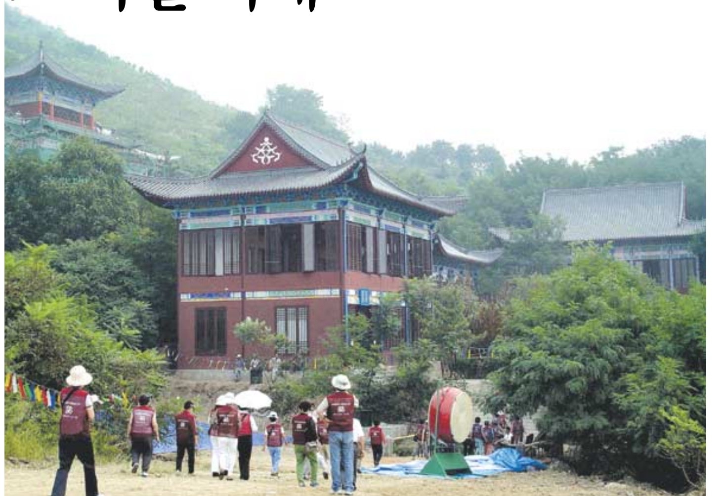
중국 칭따오 한국사찰 장안사 전경. 대지 1500여평에 대웅보전(40평), 요사채(40평), 공양간(80평) 등의 전각이 중국건축양식으로 건립됐다.