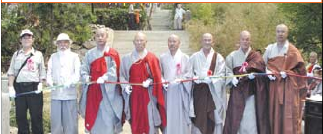
참석자들이 개원을 알리는 테이프 절단을 하고 있다.

100년 전만 해도 작은 어촌에 불과했던 칭따오는 현재 800만명에 이르는 거대한 상업 도시. 15년부터 한국기업이 칭따오에 들어서면서 경제발전이 지대한 역할을 했으며, 현재 칭따오 경제를 한국기업이 이끌고 있다는 평을 받고 있다. 현재 칭따오에는 교민 6만여명, 조선족 10만여명이 거주하고 있으며 이미 개신교 측에서 선교에 앞장서 교회와 성당 5-6개가 있다.