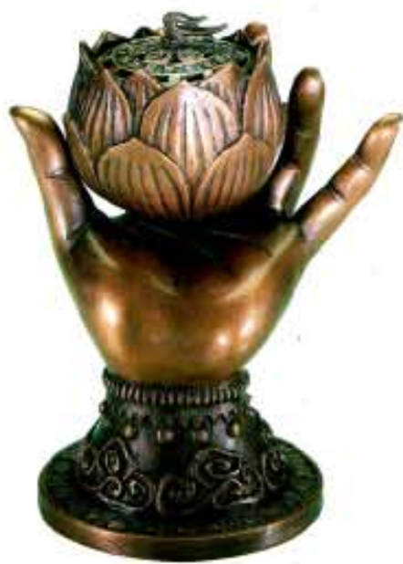
무게 2.7kg 높이 20cm 가로 17cm

불교에 입각한 범구를 원문으로 제작하는 관음예술원에서 불교의 관음 신앙에 등장하는 관세음보살의 온화한 손모양과 지물을 향로로 제작해 장안불공과 축원 불공을 마치고 시편하고 있어 화제가 되고 있다. 불교에서 관세음보살은 세상 모든 중생들의 소원을 성취시켜주는 영험을 담고 있으며, 실제로 관세음 박연화는 큰 스님들로 하여금 그림으로 그려져 어려움을 겪는 불자들에게 긴급 비방으로 사용해 왔다. 출시한지 100일도 안되어 관세음보살의 성상으로 어려운 사연들이 부도 무기를 남기고 2년간 폐하기만 한 소승에서 승승을 하고, 어렵다고 생각한 이들이 5대에야 합격하고, 팔리지 않아 고민하던 부처님이 팔리는 등 관세음보살님의 윤행이 나타나고 있는 소원성취 향로다. 특히 갈산년에 부처님 공양구를 7경에 모시던 심재도 소원되고 가격이 건강하고 화려하며 화를 쫓고 있었던 이들이 풀린다는 인가를 받고 있다. 관세음보살백연화 향로는 99% 청동만으로 국내에서 불교에 입각해 제작했으며 중국에서 씨게 만들어 들어오는 향로는 만들기 쉽게 합금을 하여 2~3년만 재탄회 화복듯이 피고 부식되고 변질되지만 관세음백연화 향로는 찬란이 지나도 변질되지 않으므로 가정의 번영과 안녕을 지켜주는 기복과 수호신으로 가정에서 예불시 또는 제례시 사용하다 후손에게 물려줘도 손색이 없는 국보급 향로로 인공 받고 있다. 가격 26,000원 문의 (080-330-7555)