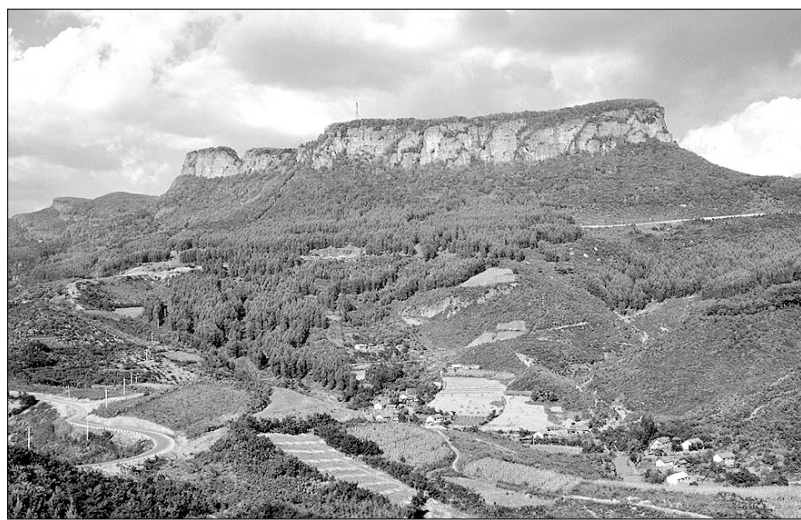
고구려 첫 도읍지인 오녀산성(중국 길림성 집안시 소재). 지난 7월 다른 고구려 유적들과 함께 세 계유산에 등재됐다.