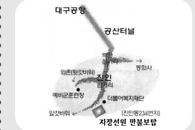
▶ 전인성거리에서 앞 갯바위 쪽으로 100미터 지점 위치

히말리아의 영원한 스승 바바지를 통하여 인간의 육체와 정신의 올바른 호흡을 제시하고 인간의 우주적 역할과 영원한 존재와의 가능성을 보여주는 명상과 요가의 수행법 그리고 호흡의 신비에 대한 이야기